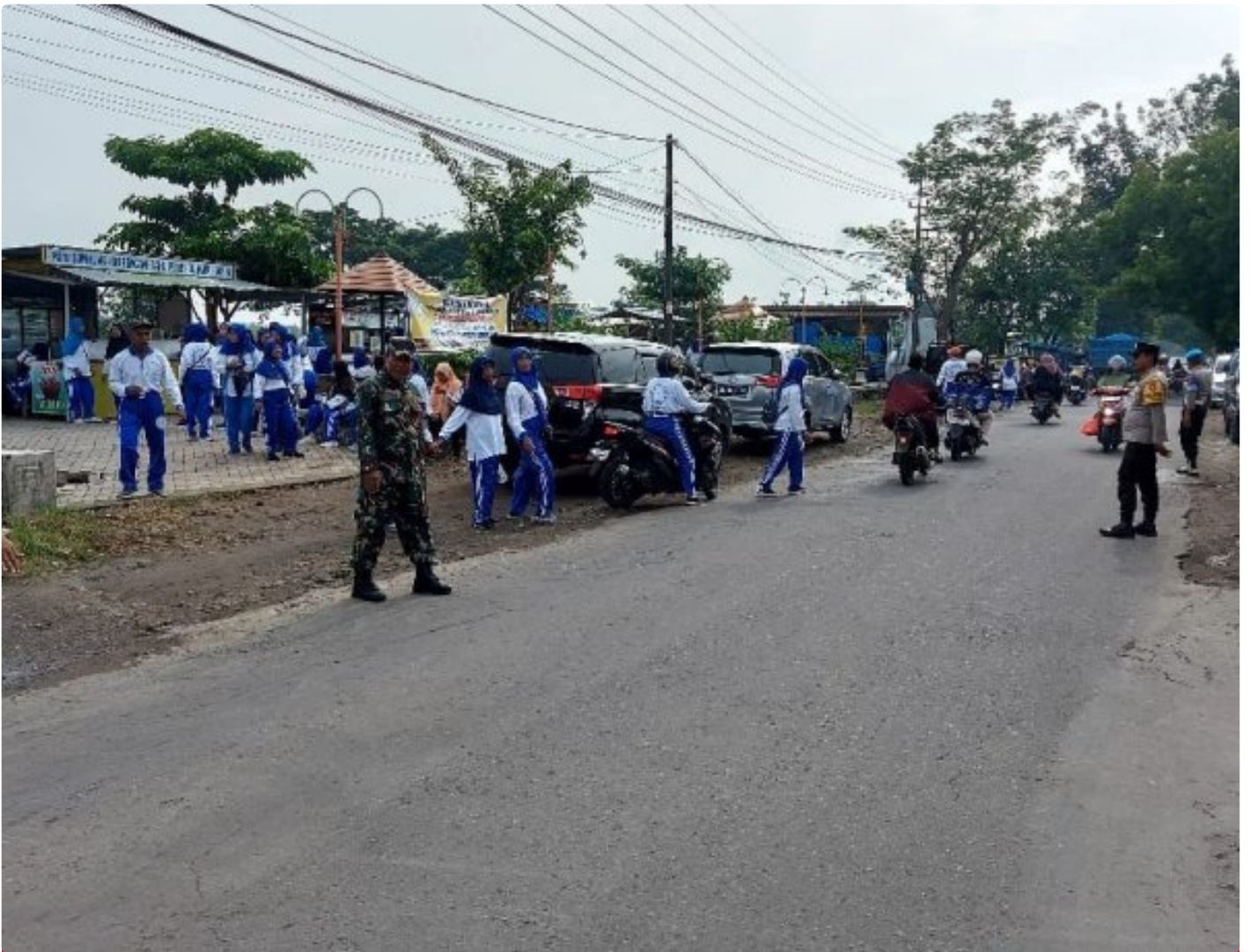
Babinsa Koramil 0804/07 Karangrejo bersama Polsek Karas Melakukan Pengamanan Latihan Bersama Koordinator Otonom Ling Tien Kung Magetan II